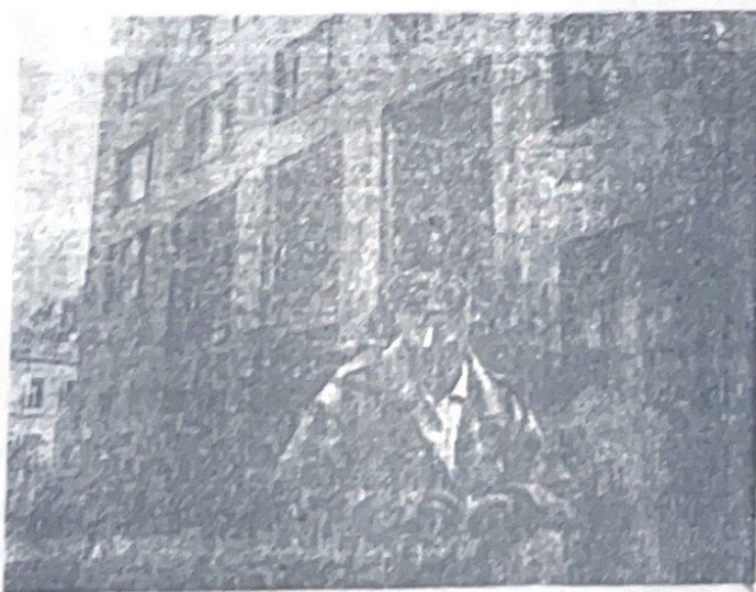
Tác giả chụp trước tòa nhà của Cục Lưu trữ Quốc gia Nga tháng 6.1993 - Matxcơva

Dưới đây chúng tôi xin giới thiệu, một tư liệu về TRẦN PHÚ, Tổng bí thư đầu tiên của DCSVN nhân dịp 90 năm ngày sinh của ông.